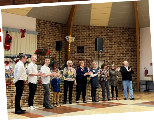
Le Club ARC EN CIEL a offert son repas de fin d'année, un bureau actif a été renouvelé après son assemblée générale