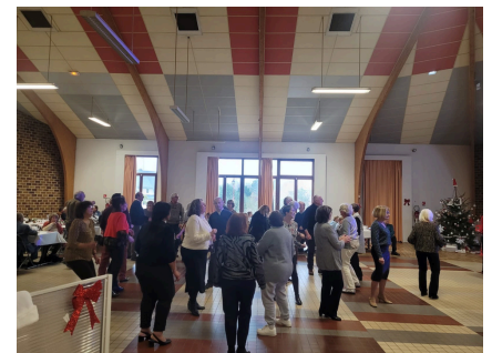
Le repas communal du Comité des fêtes ravit les papilles et invite à la danse des convives très en forme.