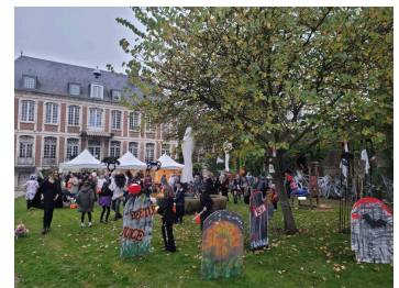
Goûter orange intergénérationnel chez Martin-Martine, après-midi d'horreur au SATO avec l'APE, les enfants de tout âge fêtent Halloween