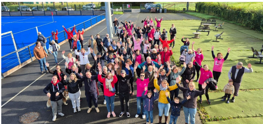
Première Marche Rose à Saint -Martin-Le-Noeud avec plus de 80 participants, récolte 700 € en faveur de la recherche contre le cancer du sein