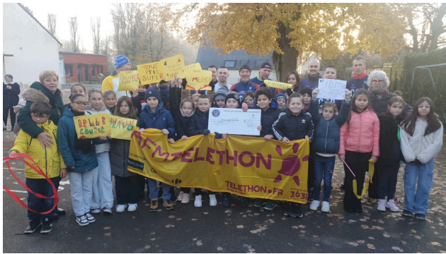
Les Pompiers organisent un matathon des écoles pour le TÉLÉTHON, nos écoliers ont récolté 293 €