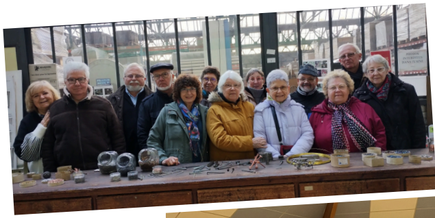
Le Club ARC EN CIEL en visite à la Clouterie de Creil