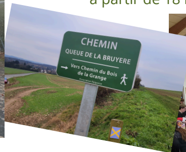
RAIPONCE installe de nouveaux panneaux