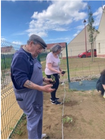
Savez vous planter les choux ? à la résidence Renelle, ce sont des salades et des fraisiers qui ont été plantés.