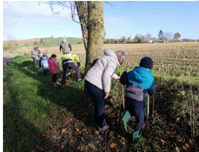
Avec RAIPONCE, les écoliers sont les champions de la plantation