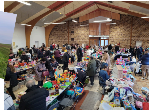
L'année des 1eres éditions : 1er vide dressing de LSSM 1ère Bourse aux jouets et articles de puériculture de l'APE Rendez vous en 2025 avec les désormais traditionnelles Bourse culturelle LSSM le 2 février et la Brocante ARC EN CIEL le 22 juin