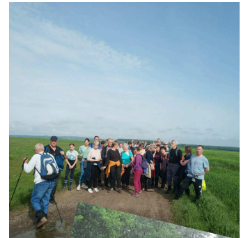
Avec LSSM, on marche, on pêche quelle que soit la météo !