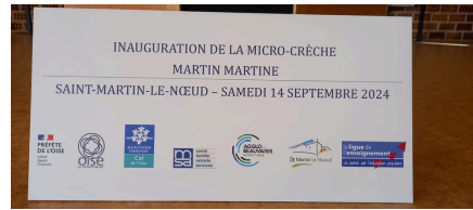
La micro-crèche Martin Martine ouverte le 2 septembre affiche complet Les entrées de septembre prochain sont à l'instruction